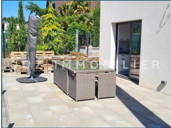
Coup de cœur